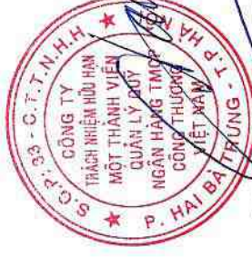
Trần Mạnh Tiến Phụ trách kế toán

Ban hành theo Thông tư số 125/2011/TT-BTC ngày 05 tháng 9 năm 2011 của Bộ Tài chính